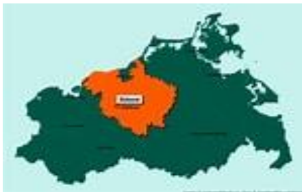
Bützow am See

Das Hotel am Markt ist familiär geführt und liegt am Marktplatz von Bützow, zentral im Ort, gegenüber vom Rathaus. Das Hotel verfügt über einen Lift. Die Zimmer sind modern und komfortable mit Dusche, WC, TV und Telefon und Internet ausgestattet. Parkplatz ist im Innenhof.