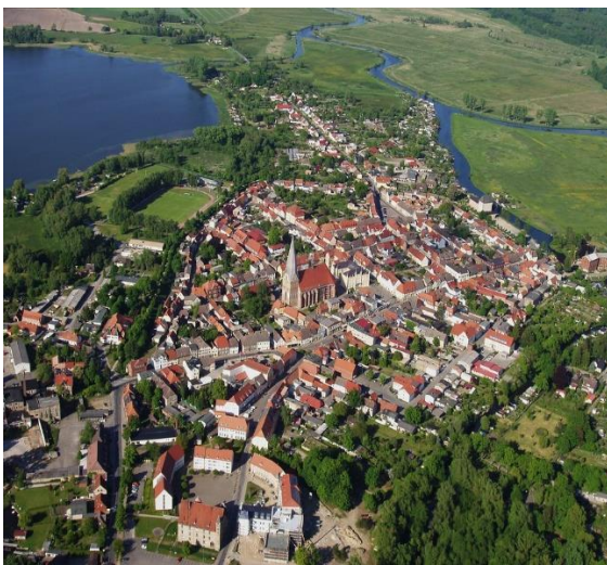
Bützow am See – Mecklenburg