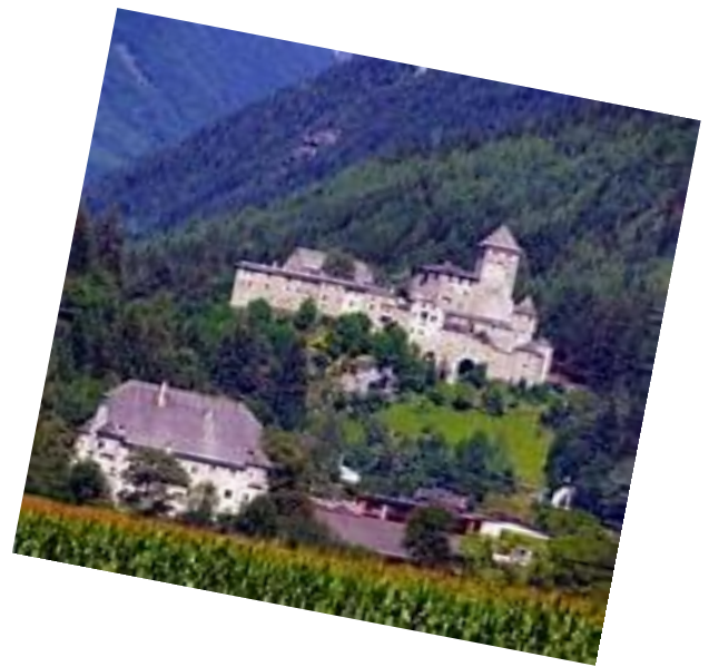
Burg Taufers im Ahrntal