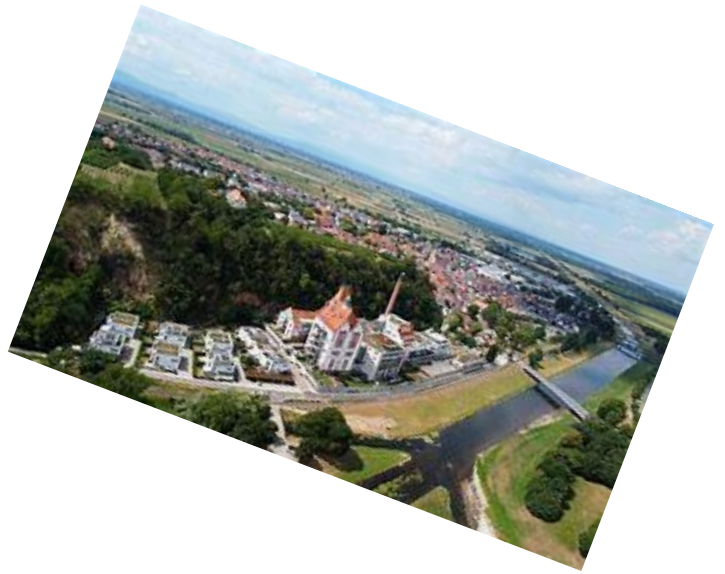
Riegel am Kaiserstuhl